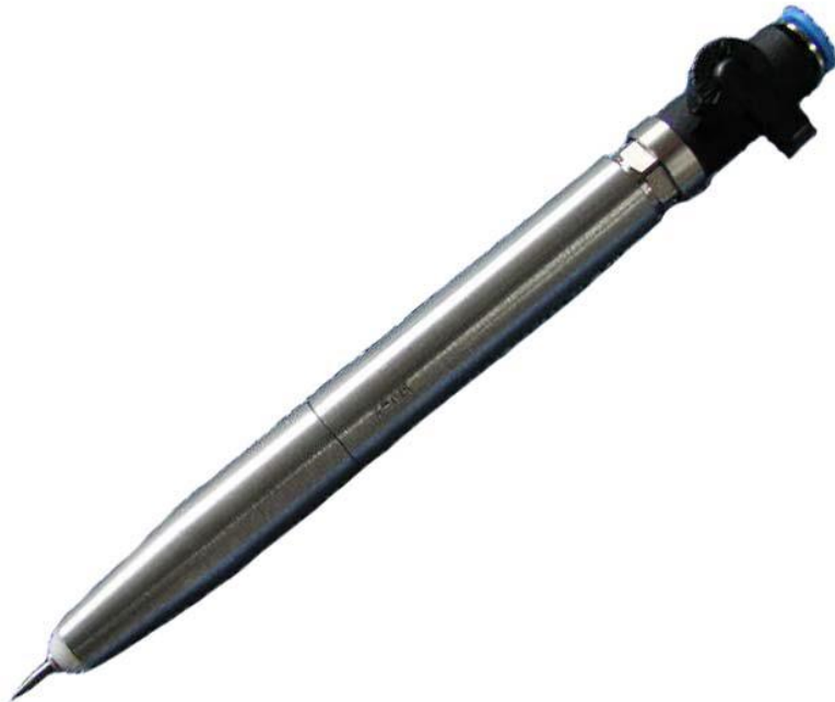
Ein Druckluftstichel zur Feinst-Präparation.